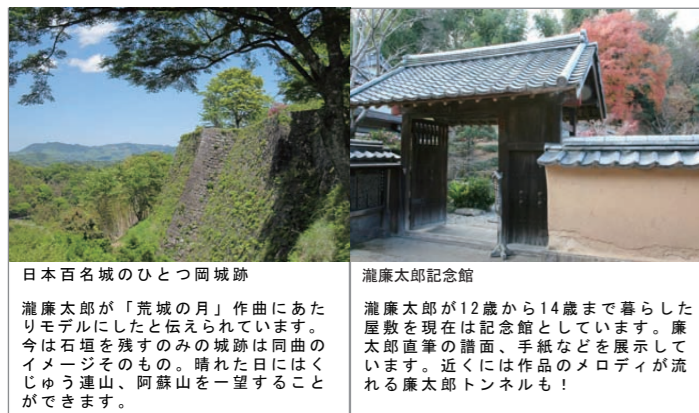
日本百名城のひとつ岡城跡 瀧廉太郎が「荒城の月」作曲にあたりモデルにしたと伝えられています。今は石垣を残すのみの城跡は同曲のイメージそのもの。晴れた日にはくじゅう連山、阿蘇山を一望することができます。 瀧廉太郎記念館 瀧廉太郎が12歳から14歳まで暮らした屋敷を現在は記念館としています。廉太郎直筆の譜面、手紙などを展示しています。近くには作品のメロディが流れる廉太郎トンネルも！