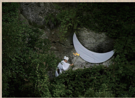
川縁の崖に彫り込まれた、三日月岩に火が灯される。