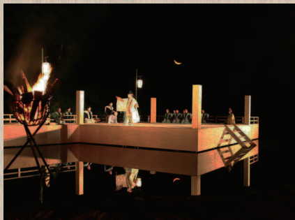
かがり火の中、幽玄な水上舞台が浮かび上がる。