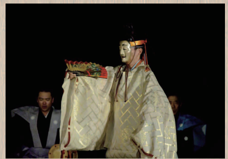
能は古く、700年の歴史をもつ。日本の伝統が凝縮されている。